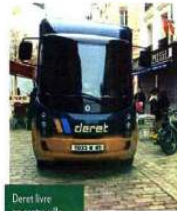
Deret livre en centre-ville avec des véhicules électriques.

Ce système a été testé depuis un an à Orléans, notamment pour les livraisons de l'enseigne Sephora, spécialisée dans les cosmétiques. Désormais, cette filiale du groupe LVMH, alimente ainsi 150 points de vente en France avec une économie de 1.000 tonnes de CO 2 en année pleine. Cette organisation permet de rationaliser les flux de